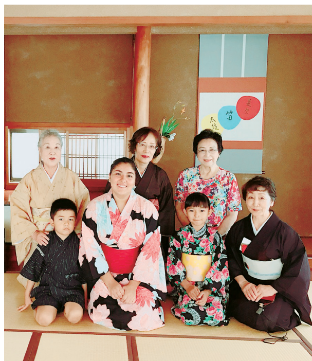
表千家の富田師匠のお座敷も日本文化の粋。 アスールさんよかったネ。