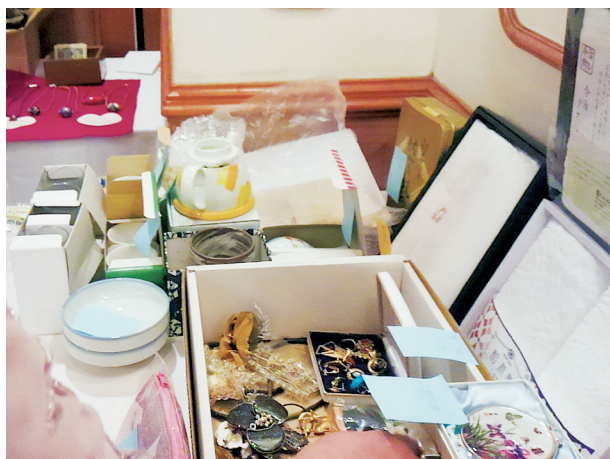
トシとったら似合わんようになるブローチ。 家族が減ったとき、このお皿も。