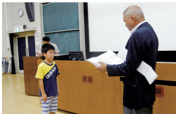
身体に気をつけながら、大いにキャンプを楽しんで下さい。

このキャンプは、もう何十年も続いており、将来の高知を担う若者を育てるためにも、桜を始めとするLCの支援が、有意義だと感じています。