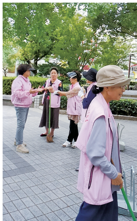
9月23日(日)早朝清掃 ピンクの女性たちのおしゃべりが消えると ゴミも消えちよりました。