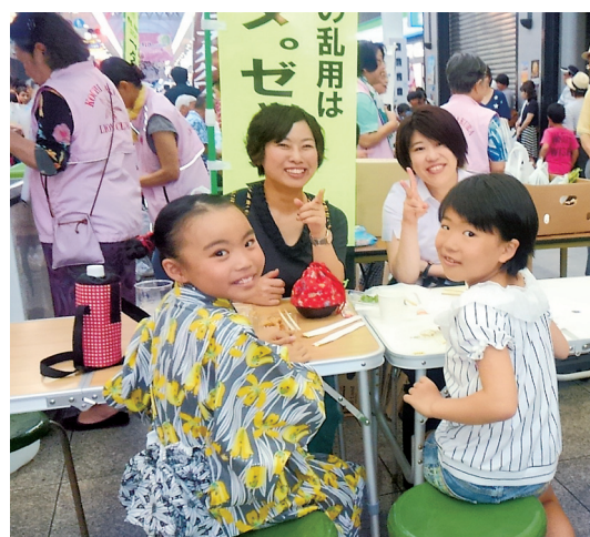
お祭りの屋台気分～おいしくたのしいナ。