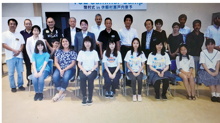
6名のYCE生同志、すぐ仲良しになりました。