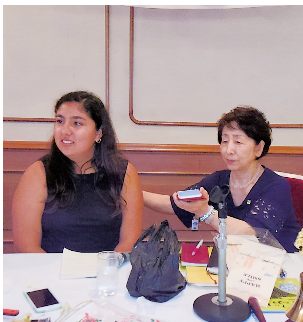
アスールさん 例会訪問 スマホで同時通訳。 桜の皆様よろしくお願ひします

帰国時「帰ったら読んでね」と置手紙をくれ、岡山まで送って行く汽車の中でも、日本語で、感謝の気持ちを述べてくれました。新幹線での別れでは、振り返り、振り返りした姿が心に残っております。桜LCの皆様心から感謝いたします。