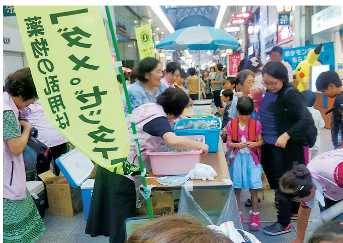
ジュースにする？ それともカルピス？