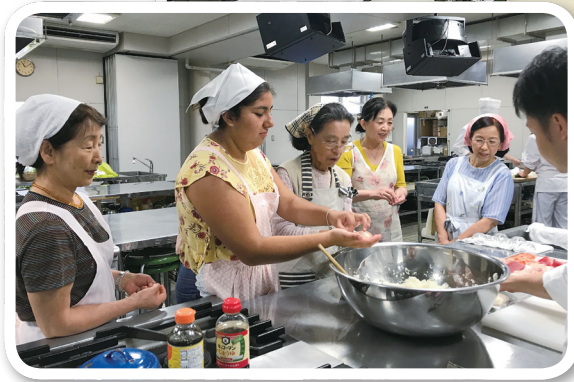
桜 LC 会員とともに和食体験

スローガン Liberty, Intelligence, Our Nations Safety