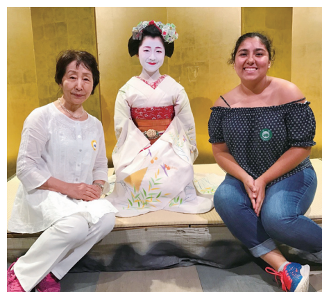
おかあさんが「日本文化の粋」京都にも つれて行ってくれました。