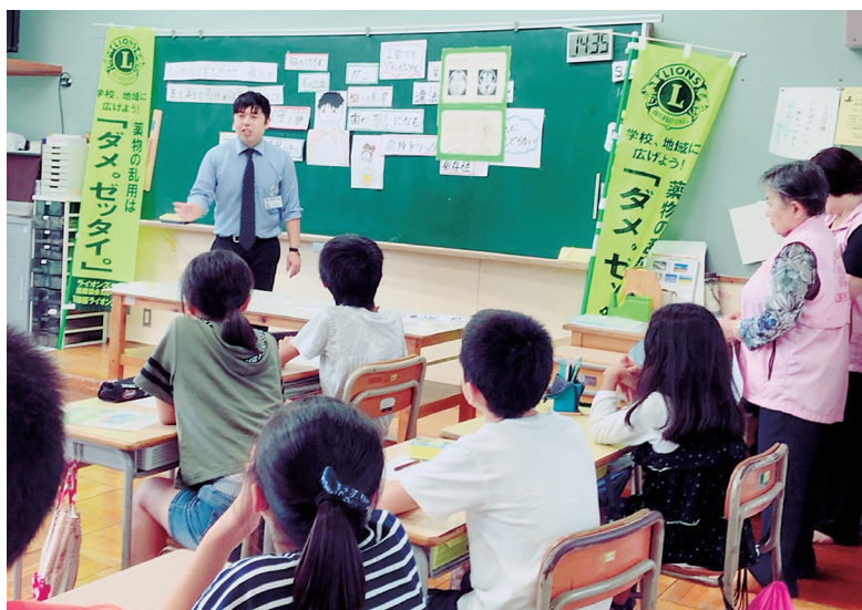
熱意ある大学生講師の話、子ども達の将来に期待したい

将来この子供達が様々な形の誘惑にあった時、この教室で勉強した事が心に残っていて頭をよぎってくれたら、きっとキツパリと断ることが出来ると思います。それを期待しています。