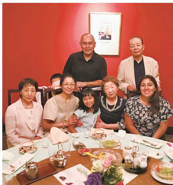
やさしいホストファミリーの皆様ありがとう！