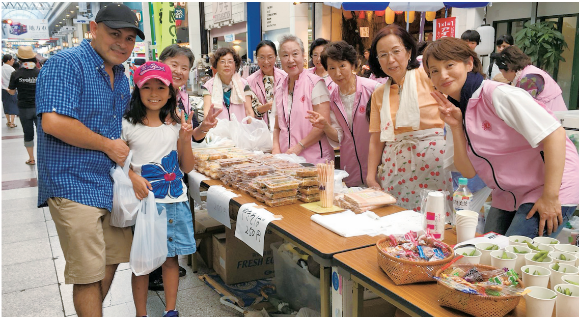
おつまみ、ありますヨー！ 唐揚・ちらし寿司・焼そば、おいしいですよー！

知った方もたくさん来店してくださり、高知の狭さ・あたたかい人のつながりを実感しながらの販売。唐揚げ、ちらし寿司、焼きそば等はあっという間に完売でした。来年も必ずビール販売やります。飲むのが好きな私にぴったりなチャリティ活動、と皆さんも思われるのでは。