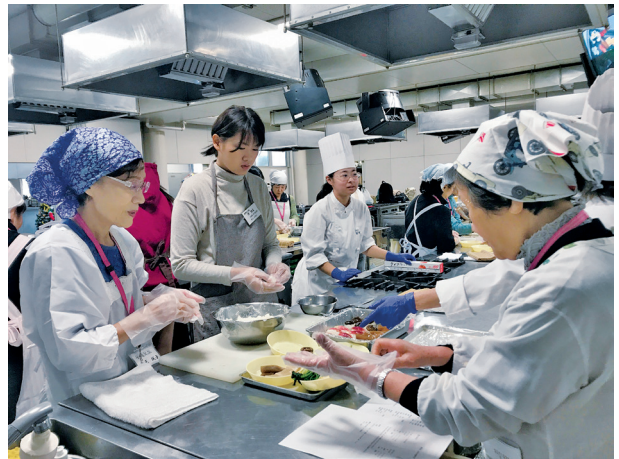
「今は SUSHI って国際的な料理ですからネ」とコツを伝授しています

続いていけばな。池坊教授の甲藤会員から説明を受け、真剣な表情で花を活ける留学生たち、出来上がった生け花に大満足の様子。感想を聞くと、「日本の文化を楽しく体験できてよかった。ありがとうございました。」とお礼の言葉があり、会員たちも笑顔になりました。