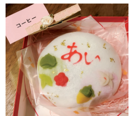
藍より愛を込めて、お土産です