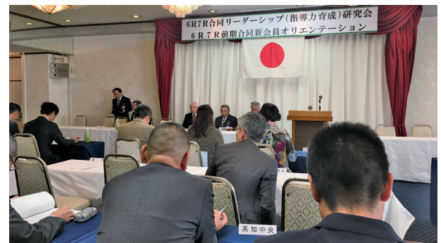
ひょっとして幹部候補生？皆さんまじめに受講中

納得しながら、何歳になっても向上心を失わない柔らかい心の持ち主でありたいと思いました。