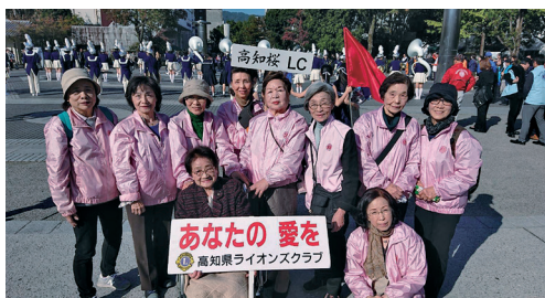
桜色のブルゾンは若々しくて ゲニ目立つから笑顔になるネー

「あらステキ!」「パワフル!」と言ってもらえるには？と、考えたスタイルでした。それが続いているって、嬉しい!