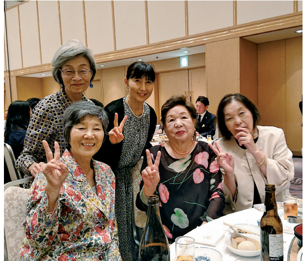
生バンド、ダンスを楽しみ、若返った桜のメンバーの笑顔

素晴らしい生バンドやダンスを楽しむ人たちの雰囲気にもまれ、誰とはなしに誘いによってダンスの輪に飛び込んでいました。学生時代を思い出しながら身体を動かしていると若返った気になっていました。菱田RCや沢山の仲間達の軽やかなステップ、にこやかな笑顔に包まれて楽しい時間を過ごしました。