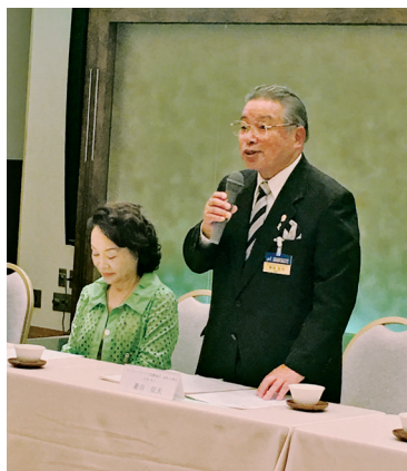
菱田6RC、下村6R-1ZCという豪華ビジターです