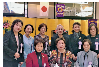
四国のすばらしい女性達が集結