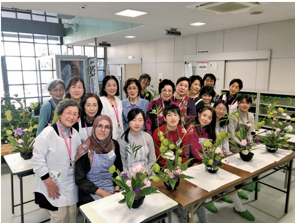
「活け花」って日本のお座敷だけじゃなくて、幅広くなっていますよネ

小春日和の良き日、中国、台湾、マレーシア、ベトナムからの留学生たち6名を迎えてお寿司作りといけばな体験がありました。職員の皆さんが準備してくださった寿司飯、田舎寿司の具材でそれぞれが握ったり巻いたり、少々いびつもありますが楽しみながら作っていきます。出来たお寿司をひとつくちー「おいしい！」笑顔がまた可愛い。