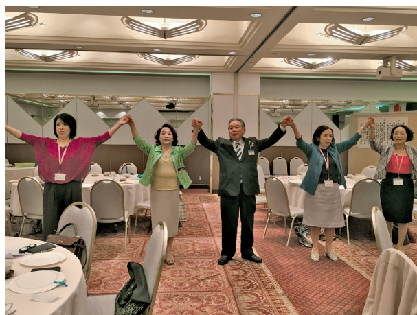
微笑みつ別れむ 友情込めて…。 今回も楽しい合同例会でした

だと思いますが、前の人の背中に紙皿を貼り、その人の良い所とか書くように言われました。