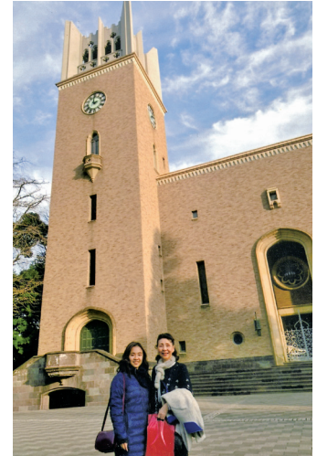
姪の子の学校、早稲田大学大隈講堂