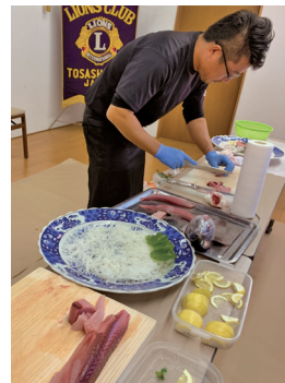
土佐清水で食べた“清水サバ”の味。ゼッピンよ!

式典の後はバンド生演奏を挟み祝宴へ。お料理のメダマは実演付きの清水サバの刺身、その美味しさに大感激!! 身も心も満たされた記念祝賀会でした。