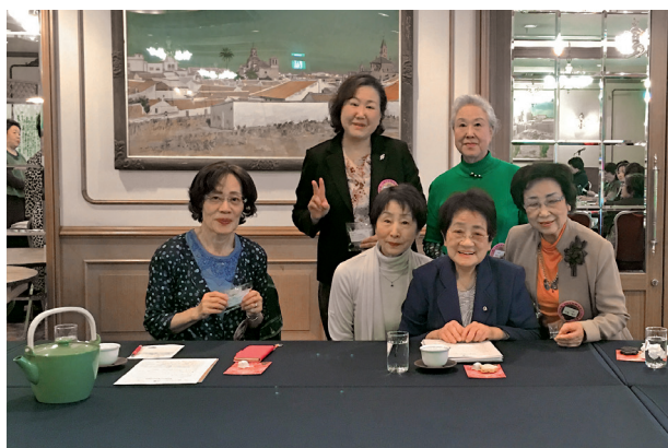
LCIFに功績のあった6人にバッチ贈呈