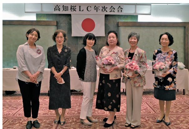
新三役からの花束を「コロナ、大変でしたね」