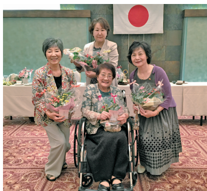
3・4・5月に生まれた美老女たち