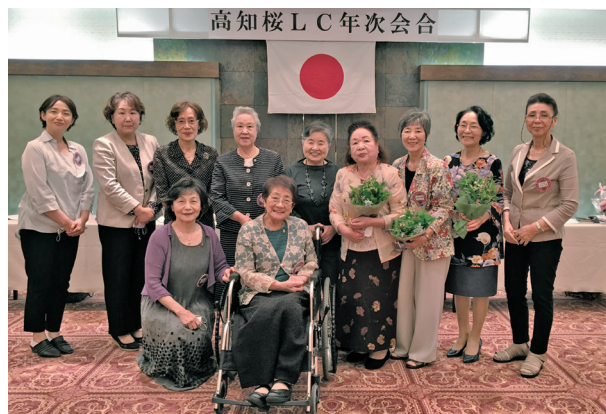
歴代会長経験者たち

審議に時間を取ったので、もう会場借り上げの時刻。3月4日の例会から中止続きで「お久しぶり！」それに加えて「執行メンバーさん大変でしたネ。ほんとに、ありがとう！」