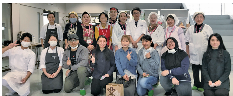
達成感いっぱいハイピースの留学生たちと先生、桜の会員達