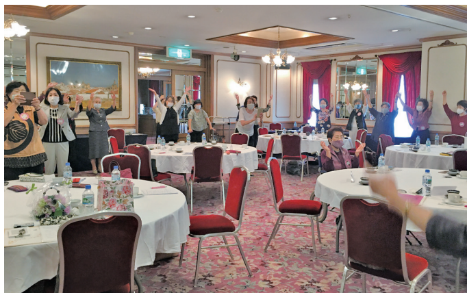
女性クラブ同志の明るさと気易さ。課題もしっかりと捉えていこうネ

お食事タイムは、語り合い、会場いっぱいの和やかさ。でも、予定の時刻…あゝもっとおしゃべりしたいのに。みんな明るい表情の姉妹でした。