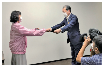
子ども達に桜の愛が届きますように！

長、副部長、児童家庭課課長、桜5名の参加。金銭でなく女性の目線で食材を求めた青少年委員会の皆様の誇りに思いました。