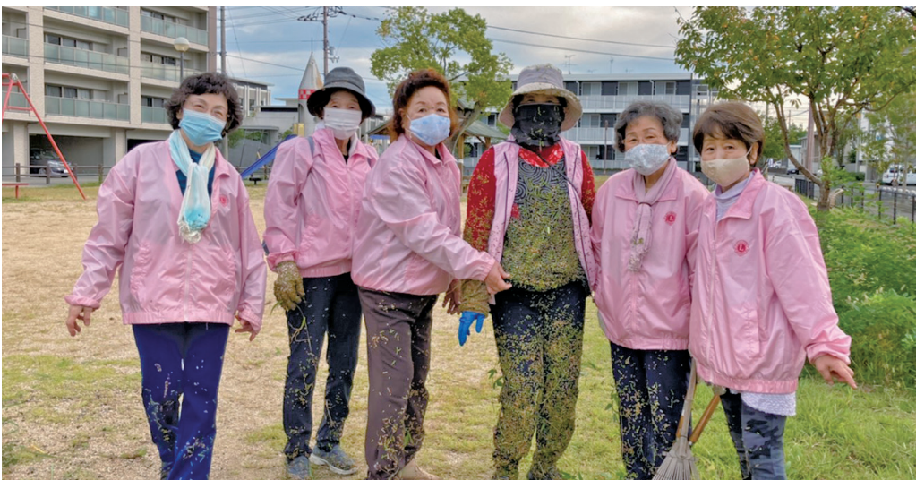
雑草と格闘すること 3時間半の桜のメンバー