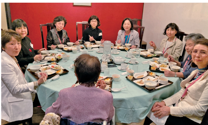
「あんたらァ、仕事もうまくいきゆうし、奉仕に知恵と時間を割いてみん？」と楽しくおしゃべりしながら

今回集まって頂いたゲストは5名。元会員の2名とメンバー含め総勢17名。ゲストの皆さん全員自己紹介のスピーチやパフォーマンスも完璧で、何よりも明るく元気でユーモアとパワーを感じました！未来のさくらの力になって頂けますよう、入会を切に願っています。この日のために参加を含めご尽力頂いたすべての皆様に心よりお礼申し上げます。