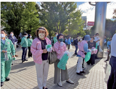
ゴミが少なくてよかったおもてなし清掃

以前は噛んだガムをそのまま捨ててあり、靴底にくっついたりしていましたが、今は流石に全体的にマナーが向上したのか、故意に捨ててあるゴミは見かけなくなりました。