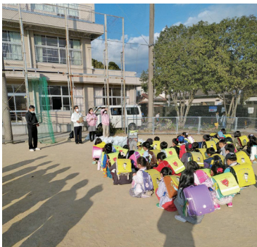
地域の人に笑顔をお届けのお花を贈呈

子供達は地域の民生委員と一緒にお花を届けに行きました。花いっぱい事業を通じての地域の方々との繋がりを感しました。