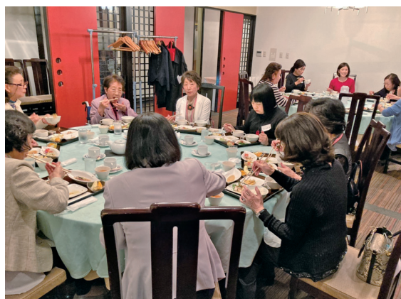
「そうやねえ、考えてみるネ」とこっこのテーブルでも