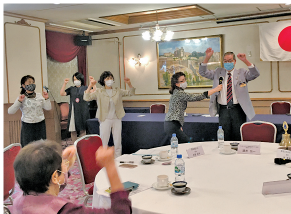
酒井ガバナーの「ウオーッ！」