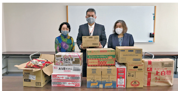
早速使わせて貰ってます！ 子ども食堂を運営する桜LC会員より