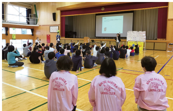
タバコの害についての講義を熱心に聞き入る生徒達

た。桜LCとしては「薬物乱用はダメ。ゼッタイ。」という事を全面に出してこれからも薬物の恐ろしさを伝えていかなければと感じました。