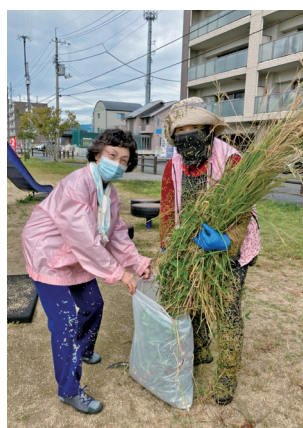
伸び放題の 雑草すごいね