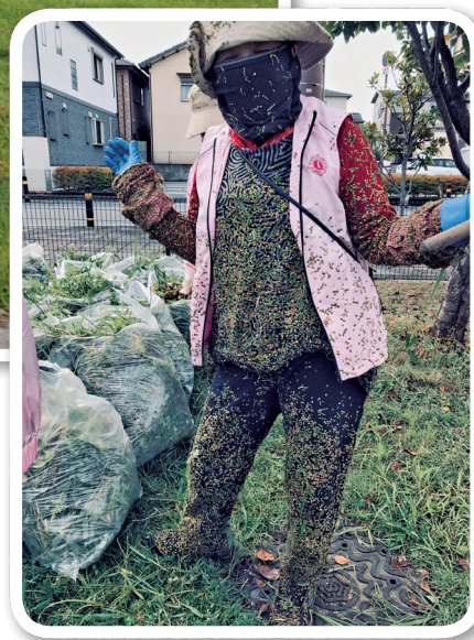
ボウボウに繁っていた雑草の山。 14人のおばさんが3時間余り大奮闘したがよ！