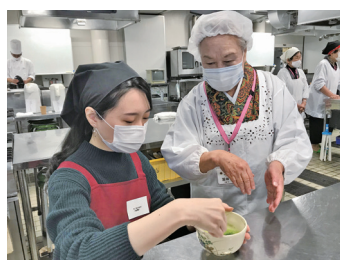
茶道師範富田会員の指導でお抹茶体験