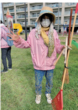
清掃後、 こんなに なりました