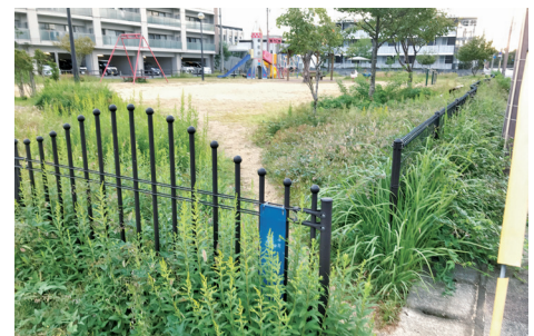
清掃前の伸び放題の雑草