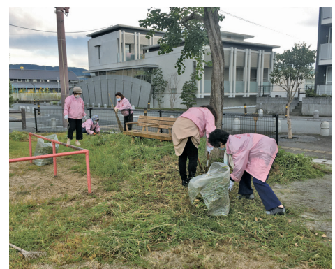
刈った草を拾い集める会員たち