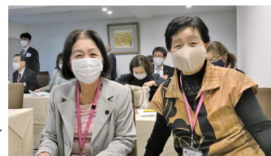
参加のマスク美人2人