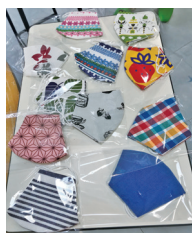
初めて作ったお寿司とプレゼントのマスク