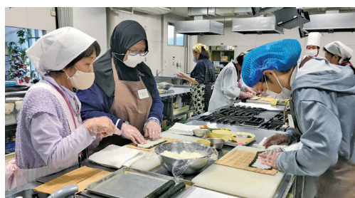
おぼつかない手つきながら真剣に！