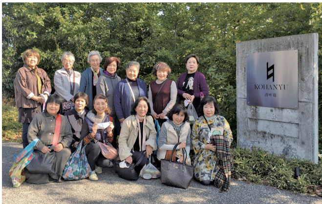
おいしい食事と素晴らしい景色を堪能したメンバーたち

プログラム委員会の呼びかけに会員と知人、友人たちと13名の参加で、天候に恵まれた楽しい一日を過ごしました。