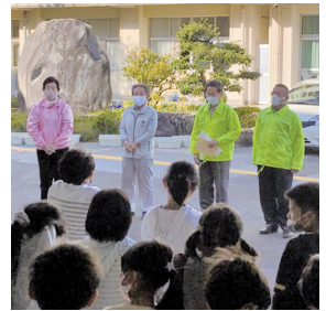
道ばたに咲く花に 子供の心が和みますように

皆さんも、お母さんのお腹の中で“生命”として誕生した瞬間は、1mmにも満たないぐらい小さかったのですが、お母さんのお腹の中で約10ヶ月大事に育てられ、“おぎゃー”と生まれてからは、周りの人皆んなに助けられながら、皆さんはこんなに大きくなりました。そして大人になり、結婚して子供が生まれます。このように命は受け繋がれていっています。“命を大切にしましょう”といった話をして、花の苗の植え方を指導しました。