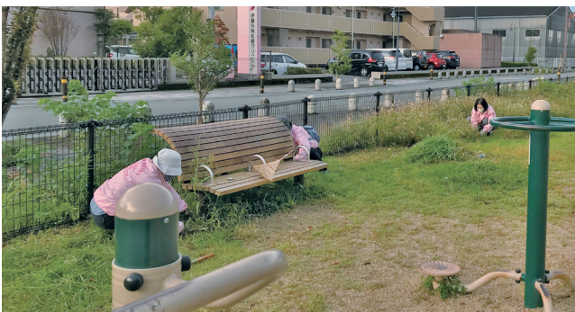
腰を屈めての 清掃は大変！