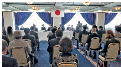
アルコール消毒、検温等細心のコロナ感染対策を取った上での会です。

最後に一人1分間コメント“ライオンになって良かったこと、ライオンとして誇りに思うこと”で全員一巡し、大変楽しい時間でした。