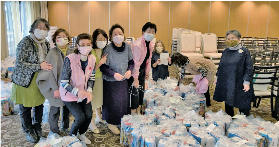
明日の地区年次大会に向けて桜のメンバーがお土産の袋詰め！おみごと。