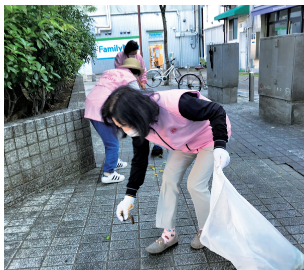
楽しみながら気持ちよく清掃、さあ、一日のスタート

今、公園は新緑がきれいで清々しく、少しの間コロナの事を忘れる早朝清掃、1日の始まりです。