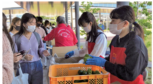
大学生たちも大喜び！高知の食材はおいしい！

で応えてくれた学生たち。いくつになっても誰かのお役にたつことができる喜びは、ボランティア活動の原動力です。