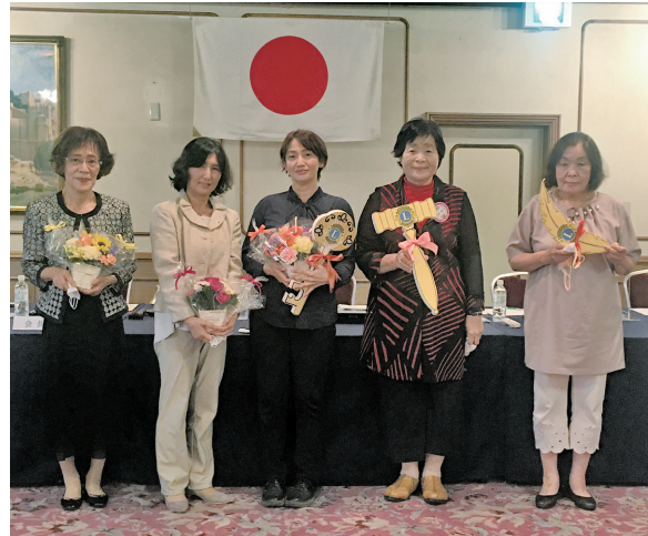
三役の引き継ぎ。コロナで大変やけどよろしくね。