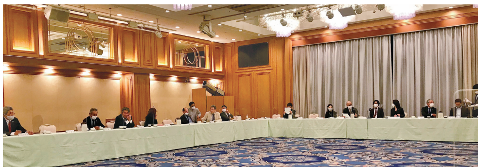
コロナ禍の中、スペースをとって熱心に会を進めます。