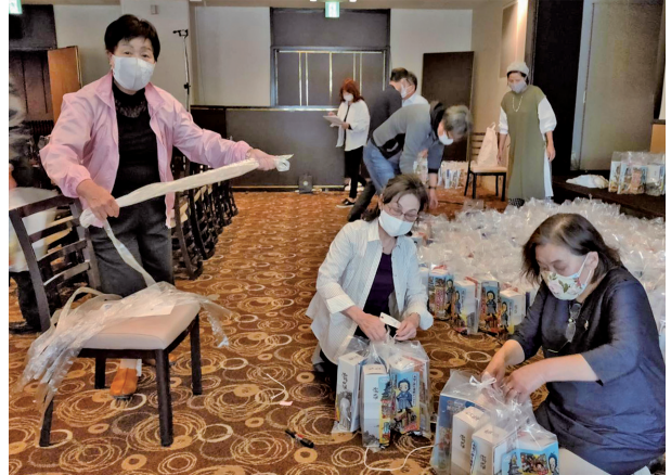
分担して手際よく、慣れた手付き！

との他クラブベテラン事務局員さんのお世辞を聞きながら、持ち前の団結力で楽しく終わりました。