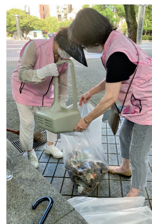
今日は落ち葉が多いねえ