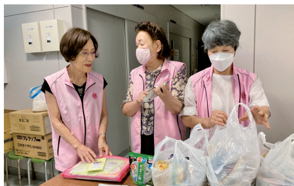
おみやげはしっかり渡しましょう