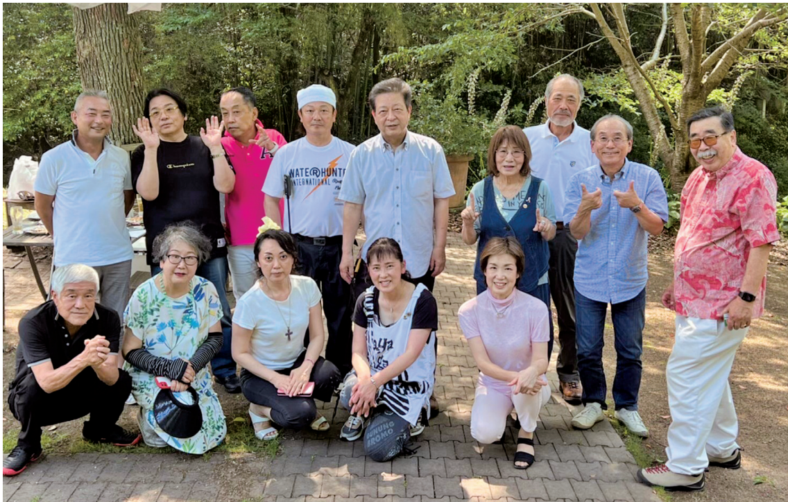
1年間の奉仕活動打ち上げ会。皆さんすっかりリラックスされた表情。

持ち込みのアルコールやジュースも頂きながらこの一年の労をねぎらい他委員会の方や現・次期キャビネット幹事さんの内輪話？も聞けて、LCではめずらしい小規模での野外会食の醍醐味を満喫し帰路に着きました。