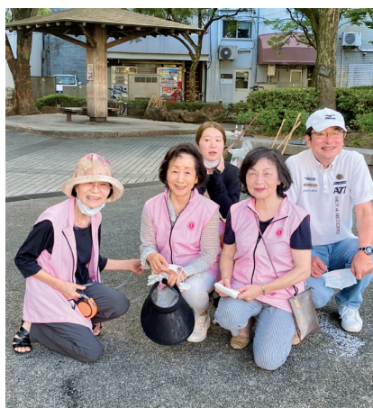
きれいになって気分も上々