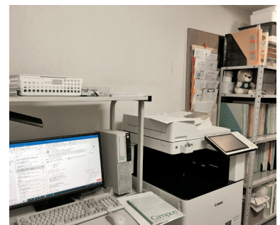
パソコン、コピー機もバッチリ！