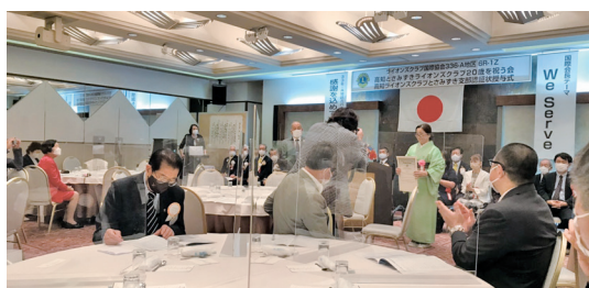
桜がスポンサーのとさみずきLC。20歳の成人式

これからは高知ライオンズクラブの大きな腕の中で安心して思い切り活動されるよう祈っております。