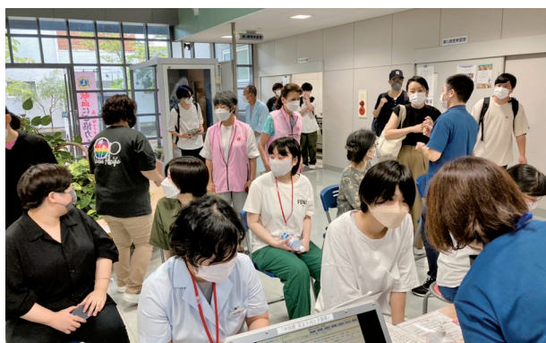
たくさんの学生さん達の協力に感謝！