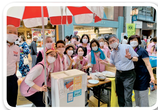
岡崎市長も桜のファン？

高知桜ライオンズクラブ会長スローガン 「思いやりの心で We Serve」 会長キーワード「感謝」