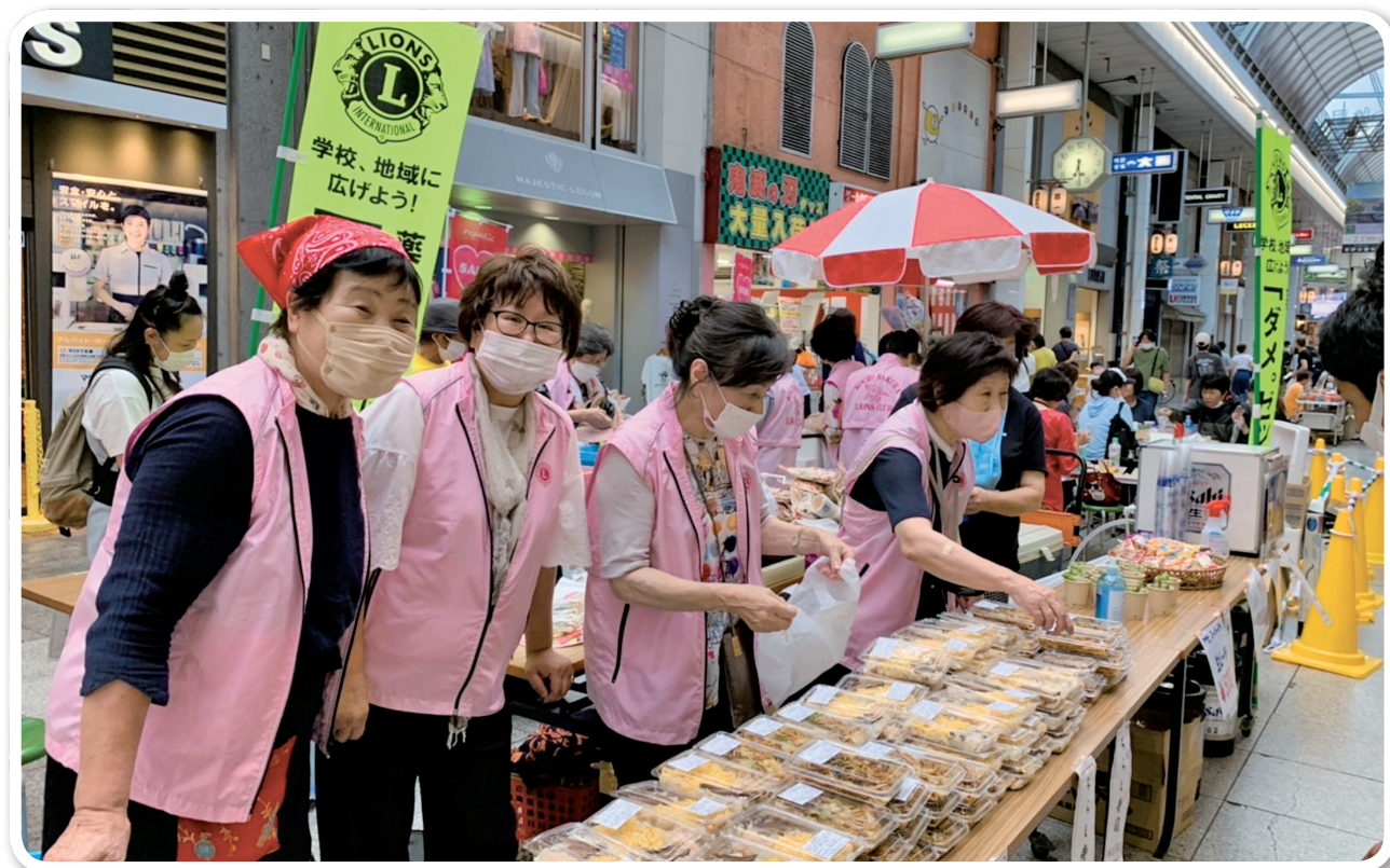
久しぶりの大きなアクティビティ、桜のパワー全開して大成功

スローガン Liberty, Intelligence, Our Nations Safety