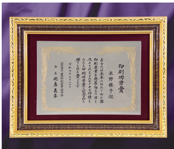
永年の功績を讃えられた表彰状、桜の会員はすばらしい！