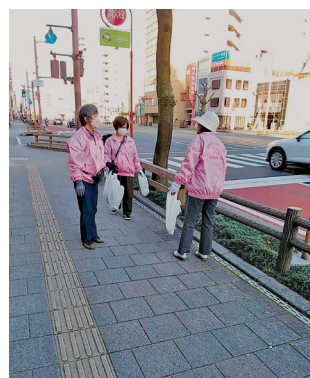
タバコの吸殻も拾って スッキリ!

朝7時に堀詰バス停前に集合し、はりまや橋から大橋通りにかけての電車通り沿いを清掃しました。