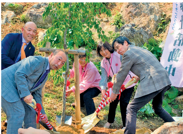
浜松さくら、高知桜、川原園長による記念すべき植樹

その後の散歩で、20年前高知桜LCの植樹した桜の木が大きく育っているのを見てこんな風に残っていく事を実感しました。