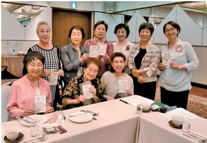
永尾会長からの絵手紙に満面の笑み