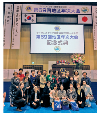
たくさんの桜の会員が参加した年次大会。初めての会員も良い経験に。

大会当日は、指名選挙会に始まり分科会・代議員総会・大会式典と時間を追ってのハードな1日となりました。第1分科会の事例発表では香川の志度 LC が、解散寸前の状況から、会員の種別を活用して会員増強を果たし、生き生きと活動されている報告と、とさみずき支部の取り組みが話されました。