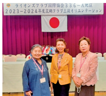
地区役員の仕事や期待、役割と頭が痛くなる程勉強しました。

期第二副地区ガバナーの挨拶に始まり、クラブ会計の任務心得や期待、役割と頭が痛くなる程勉強しました。