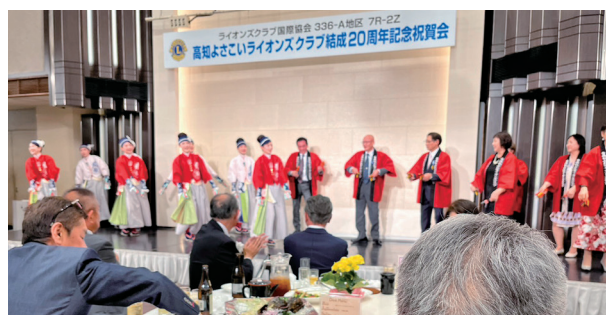
20歳の記念例会は元気そのもの

れも当たらず、他クラブの知人から「くじに当たらんやったらバチに当たるかも知れんでー」と、鉢花を頂き、無事バチにも当たらず帰り着く事が出来ました。