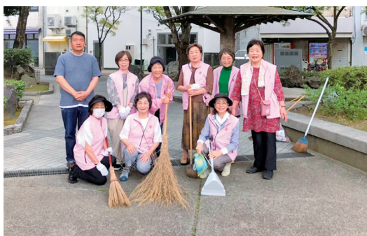
掃除が終わって清々しい 気分で「ハイ、チーズ!」