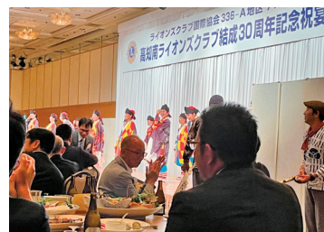
数々のアクティビティ、熱意のこもった30周年記念例会

プレゼンテーションでは、とりわけて高知商業高校女子生徒5人の紹介による【ラオス学校建設活動】について発表が行われ、生徒たちの熱意と実績に心動かされました。