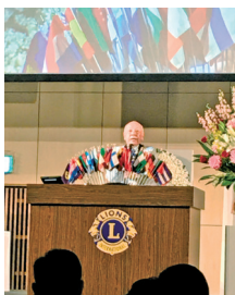
山崎ガバナーエレクトのごあいさつ