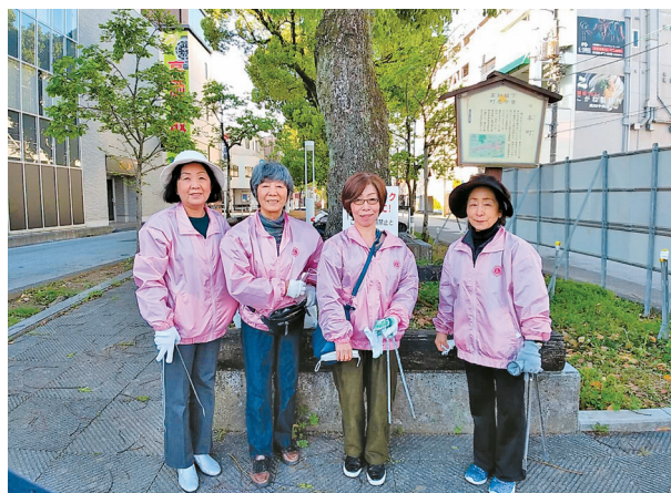
お掃除した街って愛情が沸きますネ

この春から始まったテレビドラマ「らんまん」の効果もあり、これから高知を訪れる観光客も増えるでしょうか。観光客の皆さんに気持ちよく高知の旅を楽しんでいただきたいですね。