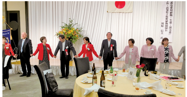
最後に皆で「また 会う日まで」皆さんに喜んでいただけて良かった。