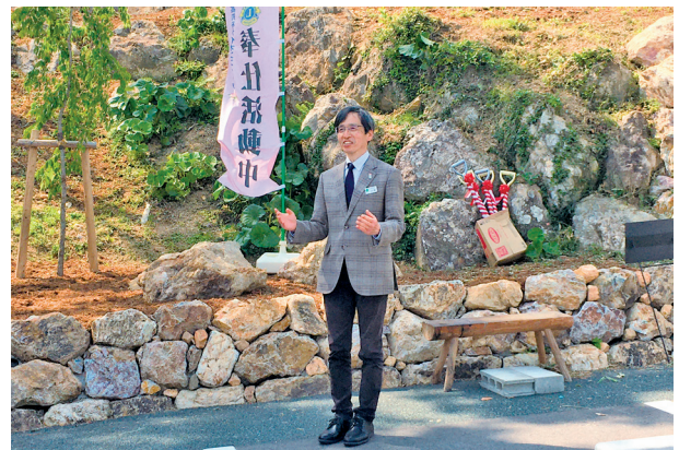
植樹のいきさつを話される川原園長。 喜んでいただけて良かった。