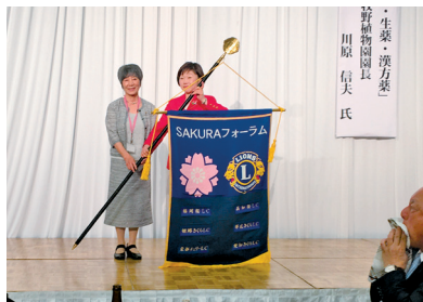
高知桜から姫路さくらにバトンタッチ

食材満載の料理が各卓で大好評。姫路さくらLCへのフォーラム旗伝達式、全員参加のよさこい鳴子踊りに笑顔がはじけました。