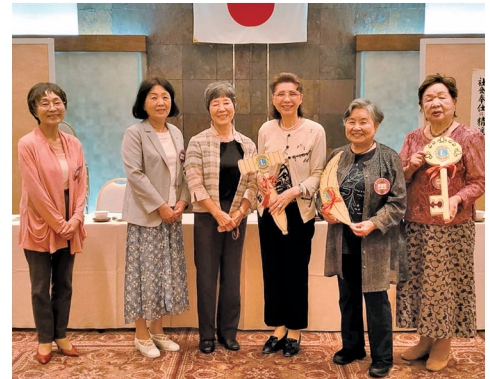
旧三役と新三役、揃い踏み