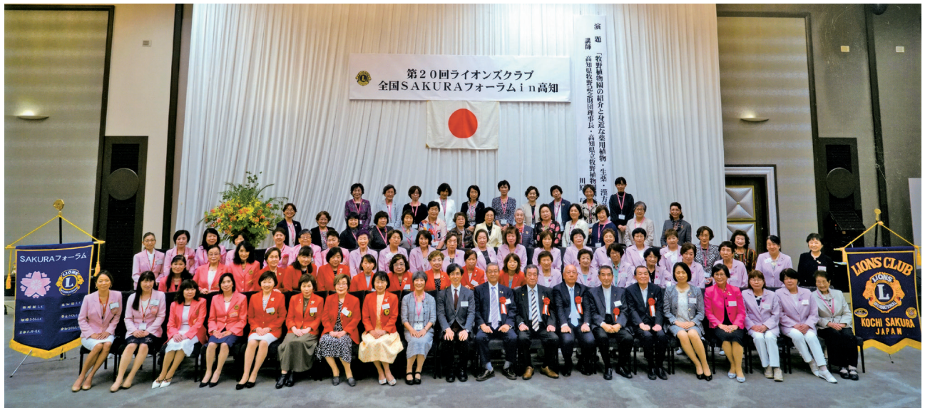
ご参加の皆さまと記念写真。