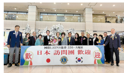
やっと国際交流が出来るようになりました

来期は高知キャビネットでの年次大会です。皆様にお会いする日を楽しみにしています。