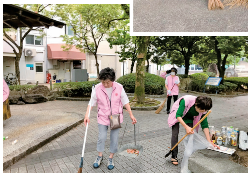
缶にピンにプラゴミに、 分別もしなくちゃ!