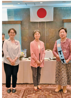
TTの引き継ぎ、よろしく。

2023.6.21(水) 於 サウスブリーズホテル いよいよ今期最後の例会。五役の引き継ぎ、会長アワード発表など、この一年間を振り返りながら、おいしい食事を共にしました。 来期の吉本丸の船出もうすぐです。