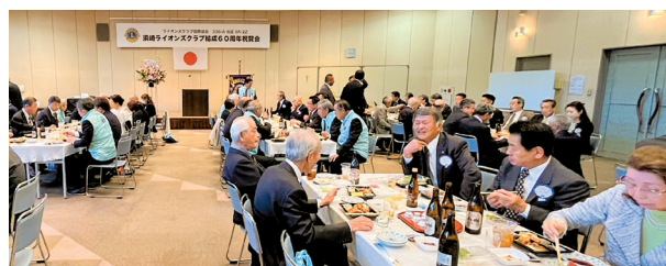
地元食材のおもてなしに笑顔の祝宴

高知桜LC7名参加、祝宴の席に着くなり、挨拶もなく、すぐ飲み食するのが須崎流とか、有名な卵焼きやその場でのにぎり寿司、また、タタキのパック詰めが配られてくる、堅苦しくない60周年の式典でした。(沖縄の宮古からも2名参加されていました)