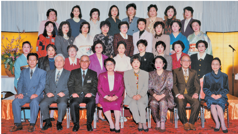
30 年前のチャーターメンバーは今、6 人居るぞね。やっぱり若いちゃ！

高知桜 LC は、“女性の正会員誕生史”と共に生まれました。30 年の歴史を、先輩・後輩のご参加、ご声援の中で、認識を深め、歩き続けます。仲良く奉仕を続けます。感謝を込めて、30 周年報いたします。