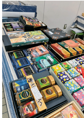
会員から出された貴重な品々