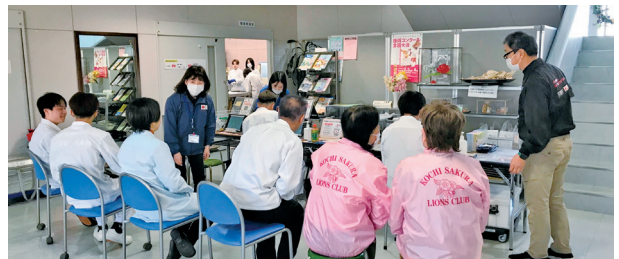
「高知は血液不足がみ」にならんように

残念ながら内1名の方が献血できず、13名に400CCの献血で合計5,200CCでした。旗を見たと言って参加して頂いた方には心から感謝します。