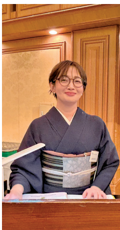
司会は粋な着物姿で！