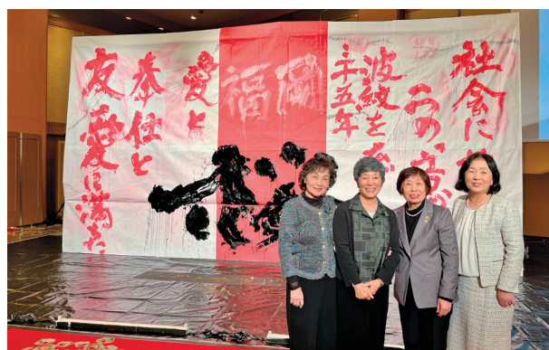
高校生の書道パフォーマンスの前で記念写真

35周年記念事業として、能登半島地震支援をはじめ、高額の仕事内容には驚かされました。さすがにハイレベルなLCだと感じ、高知桜LCの周年の成功を祈りました。