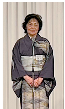
五藤会員の開宴の挨拶