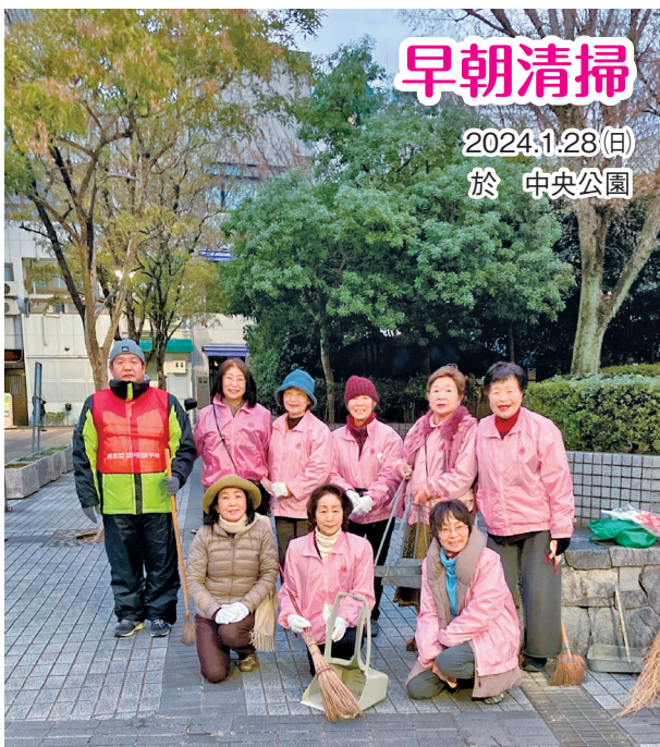
中央公園は「いつもキレイ」