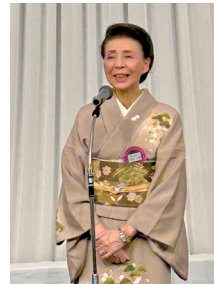
吉本会長の 新春ご挨拶