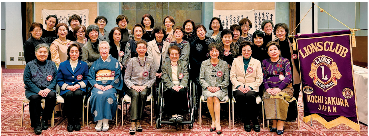
2024 年 2 月 7 日 第 725 回例会（出席率 90.9%）