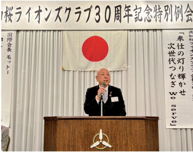
山崎地区ガバナーからの祝辞