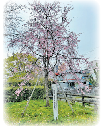
城西公園 (2015 年植樹)