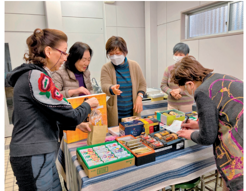
値つけは緊張しますネ