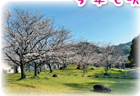
大谷公園 (1996 年植樹)