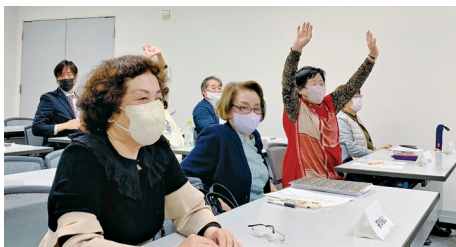
オリエンテーションの講義でライオンの知識を学ぶ