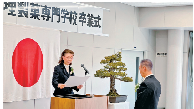
吉本会長より感謝状授与