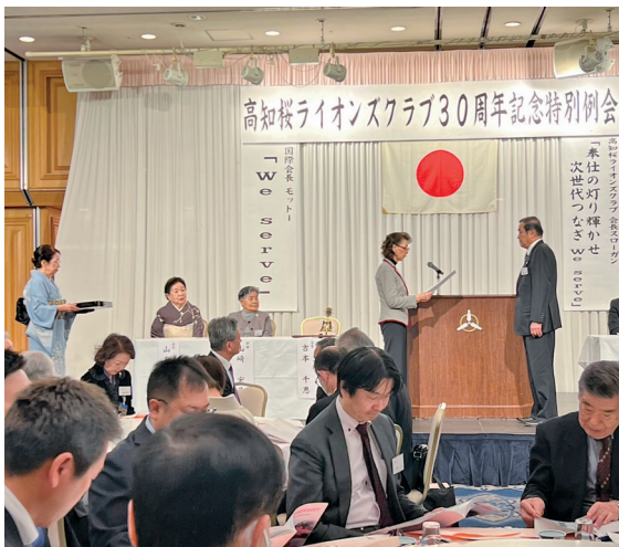
スポンサークラブへの感謝状