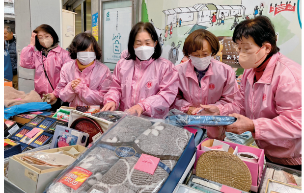
品物は結構多いねえ

今年は周年の年だったので売れ残った商品はくじ引きの景品に姿を変えます。賢い桜に無駄は無いなあと考えた事でした。