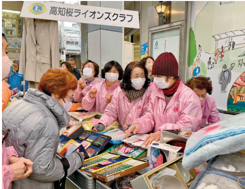
はじめて参加したけど楽しかったちや!