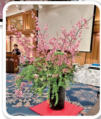
甲藤会員作の 桜が祝うてく れゆう

スローガン Liberty, Intelligence, Our Nations Safety