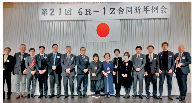
今期の新入会員の皆さん