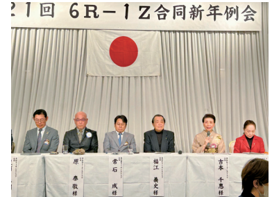
各クラブの会長達も揃って 新春ご挨拶