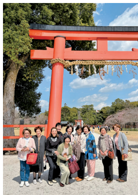
上賀茂神社鳥居前で

昨年、醍醐寺のクローン桜を牧野植物園に寄贈された浜松さくらLCのご提案で、高知桜会員10名が京都に赴きました。先方のご家族も入れて14名。