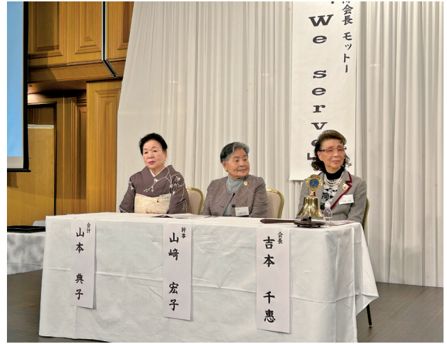
緊張のクラブ三役