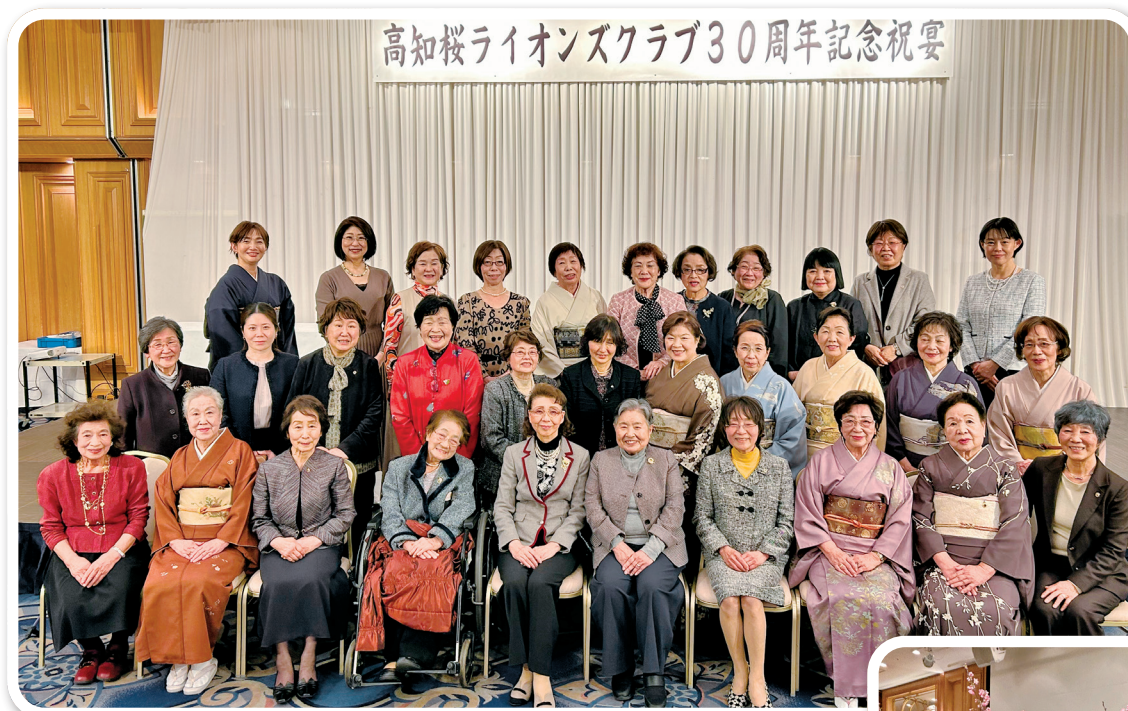
桜LCが生まれて30年の今は、女性が正会員となって30年ぞね。スゴイ！