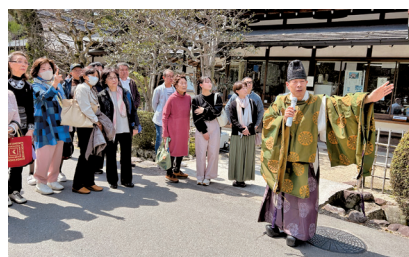
神社の権禰宜さんにご案内頂けるありがたさ

お天気にも恵まれ、枝垂れ桜は満開、ご案内いただくものは国宝・重要文化財・宮内庁管理など、見るもの聞くもの異次元の世界。