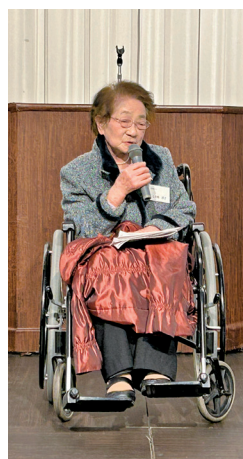
松崎初代会長はおトシに