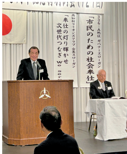
スポンサークラブの福江会長の祝辞