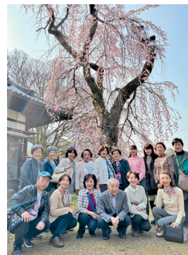
クローン桜も満開! 浜松さくらLCと合同で