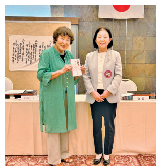
桜 LC から ボランティア連絡会へ贈呈

今後も、このような事案があれば積極的に審議し、青少年育成のために有意義な支援が行われることを期待しています。