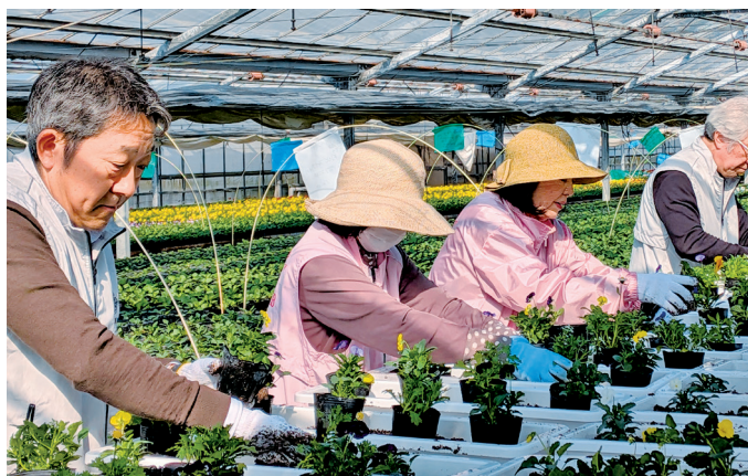
花を苗から育てます。慣れない作業です

それぞれの地域をお花でいっぱいにしましょうと、高知鏡川 LC が中心になって、各クラブが協力し、花の苗植えから始めます。高知桜 LC からは会長・幹事が参加しました。