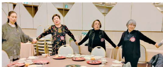
“知らなかった”人が、今は“奉仕”で“親友”に