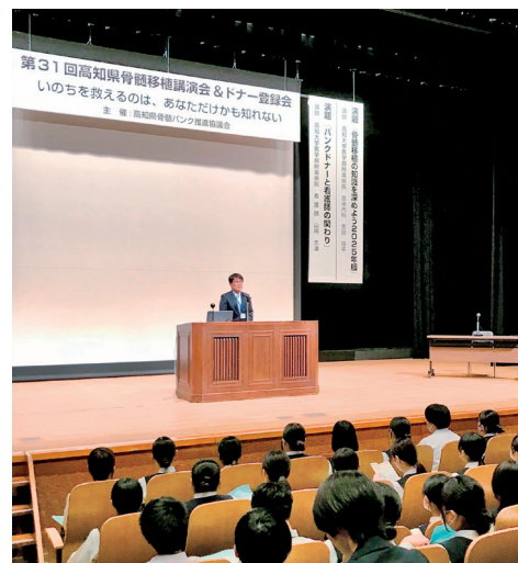
この提案活動はライオンズのみ。がんばろう！

自分の知識不足もあるが、若いドナー登録が増えるよう、ライオンズや一般社会で啓発活動をしていく重要性を感じた。