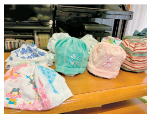
色とりどりに仕上がったタオル帽子