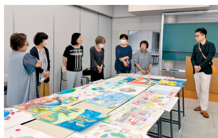
高橋氏に依頼した審査会。 委員会の皆さんの熱心な様子