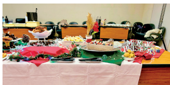
プレゼントもいっぱい