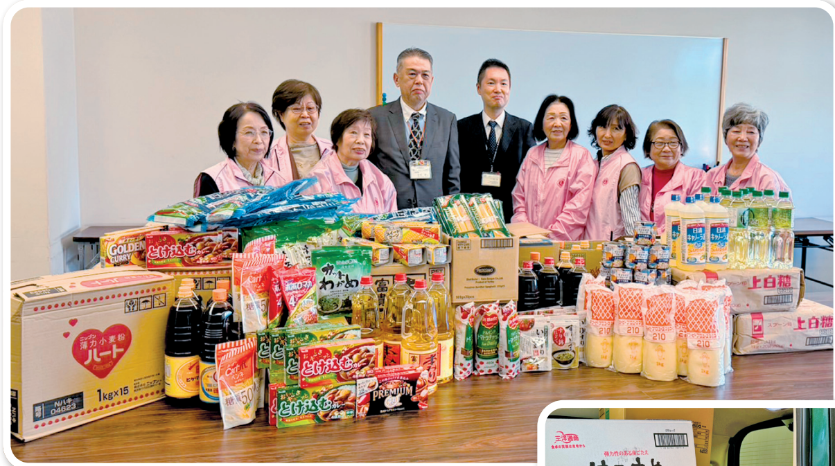
今年も届けました。喜んでいただきました。