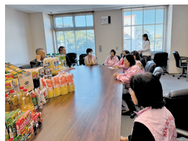
たくさんの食材を子ども食堂へ。 ずーっと続けたいですね

只、所長からは「とても助かっている、またよろしく！」もうこの一言で頑張れるから、皆さん続けましょ うね。