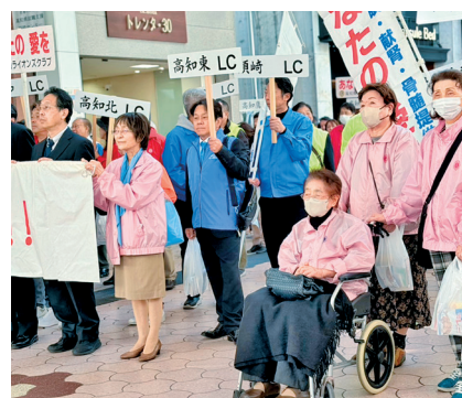
提案した人は今、車椅子