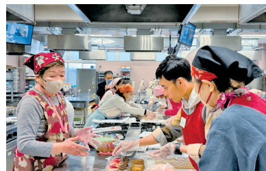
会員に手ほどきを受ける留学生

い鶴 2 羽、1 羽は千羽鶴用、あとの 1 羽は記念にお持ち帰り用です。スムーズに運び、記念写真も撮って和やかに終了しました。