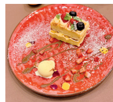
最後に 可愛い デザート