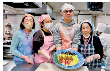
きれいに出来ました。