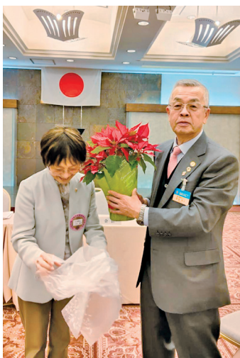
金谷第二副地区ガバナーに ポインセチアのプレゼント