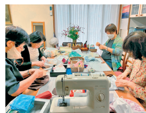
チクチクと皆で針を運びます