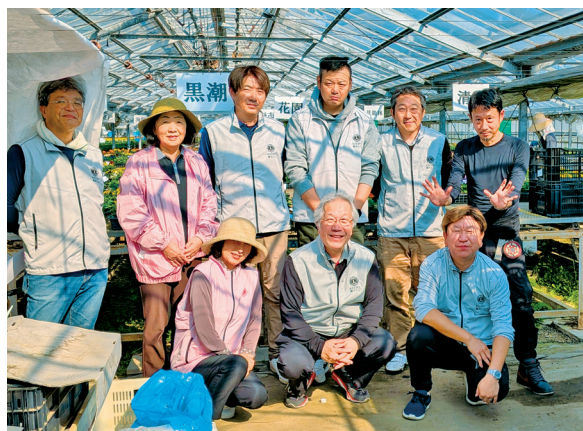
ハウスの中、作業を終えて皆笑顔

それぞれの地域をお花でいっぱいにしましょうと、高知鏡川 LC が中心になって、各クラブが協力し、花の苗植えから始めます。高知桜 LC からは会長・幹事が参加しました。