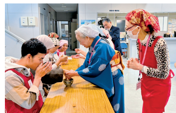
富田会員指導でお抹茶をいただく