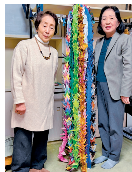
見事に出来た千羽鶴、長崎へ旅立ちます