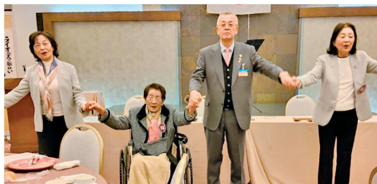
2025年最後の“また会う日まで”